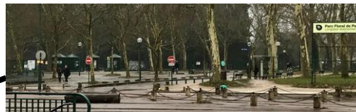
Grilles d'entrée du Parc Floral