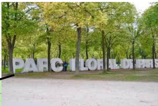
Grilles d'entrée « Château » du Parc Floral