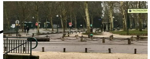
Grilles d'entrée du Parc Floral

Les bus 46 et 112 s'arrêtent devant et à proximité directe du parc floral