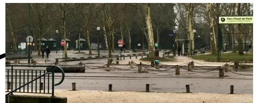
Grilles d'entrée du Parc Floral

Les bus 46 et 112 s'arrêtent devant et à proximité directe du parc floral