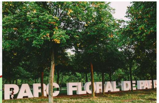
Grilles d'entrée "Château" du Parc Floral