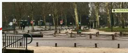
Grilles d'entrée "Château" du Parc Floral

Les bus 46 et 112 s'arrêtent devant et à proximité directe du parc floral