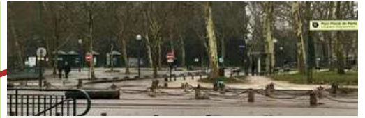
Grilles d'entrée "Château" du Parc Floral